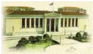
ΕΘΝΙΚΟ ΚΑΙ ΚΑΠΟΔΙΣΤΡΙΑΚΟ ΠΑΝΕΠΙΣΤΗΜΙΟ ΑΘΗΝΩΝ Πανεπιστημίου 30, 106 79 Αθήνα

4rd INTERNATIONAL CONGRESS OF KARPATHIAN FOLKLORE