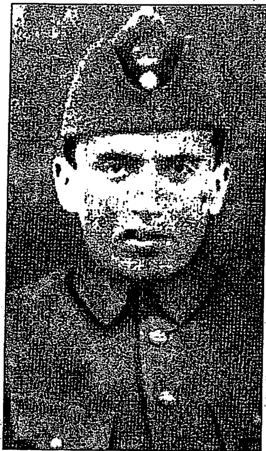
Ο Κ. Καρυωτάκης στρατιώτης, 1919-20.

Η «συστέγαση» της μελέτης του Άγρα με το κείμενο υπέρ του μυθιοστορημάτων του Καραντώνη στο τεύχος του Δεκεμβρίου 1935 των Νέων Γραμμάτων , φαίνεται ότι δεν άφησε αδιάφορο τον Οδ. Ελύτη, ο οποίος εντούτοις παρά τη συνεργασία του με το περιοδικό, όπου πρωτάνευε το συναινετικό πνεύμα του Γ. Κατσιμπαλή 26 , θεωρούσε ότι τα Νέα Γράμματα «ήταν ένα περιοδικό "μεικτό" χωρίς ξεκαθαρισμένη γραμμή», και ως εκ τούτου γινόταν επιτακτική η ανάγκη έκδοσης κάποιου άλλου περιοδικού, «οργάνου μαχητικής πρωτοπορίας που θα 'κόβε κάθε γέφυρα με